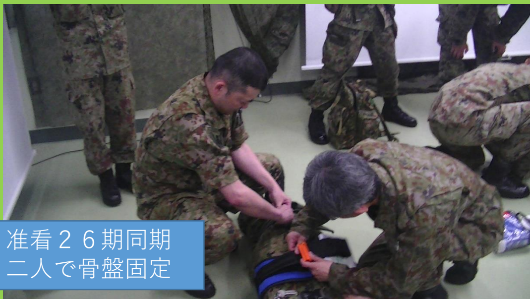
准看26期同期 二人で骨盤固定