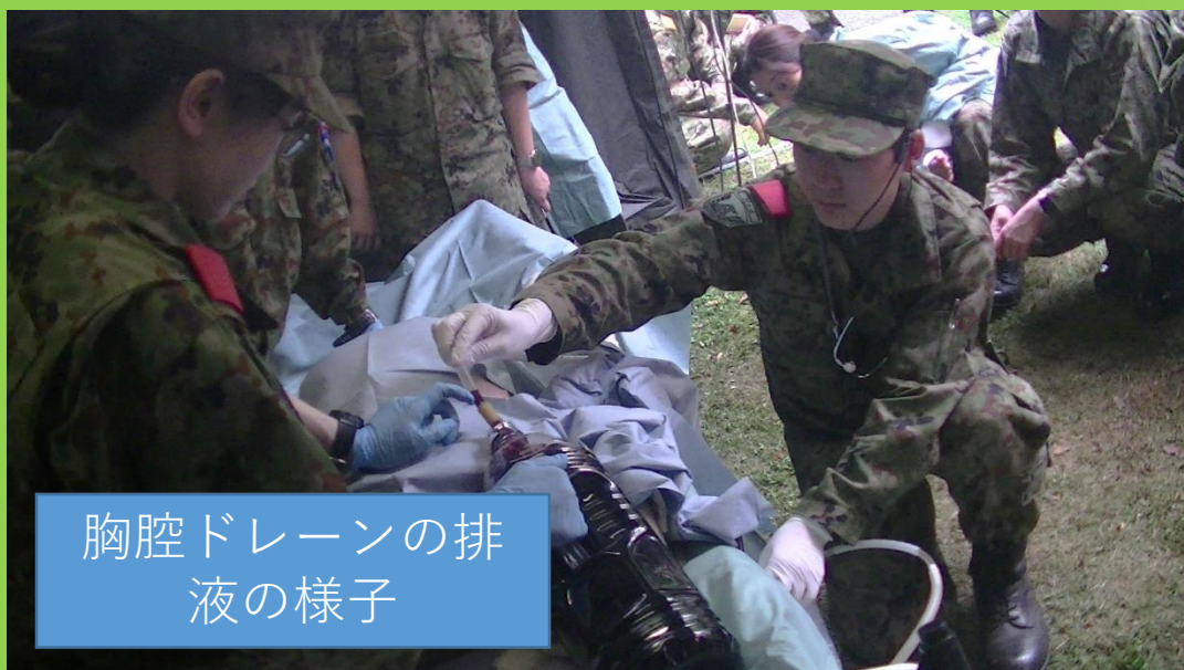
胸腔ドレーンの排 液の様子