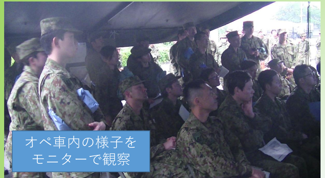
オペ車内の様子を モニターで観察