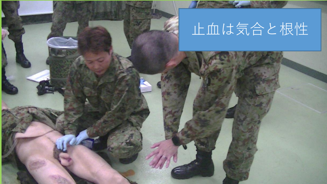
止血は気合と根性