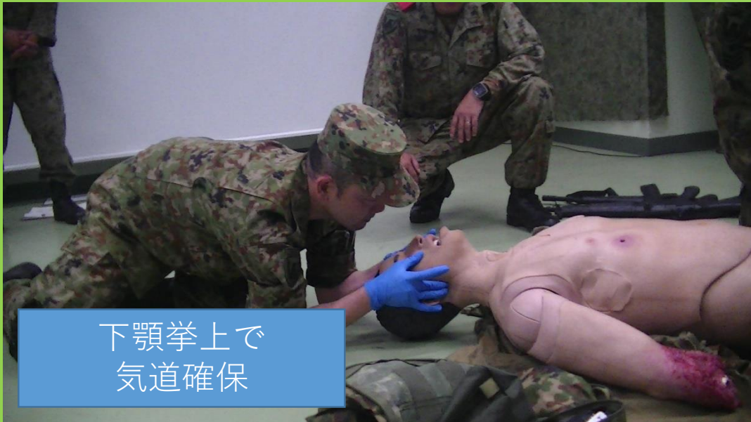
下顎挙上で 気道確保