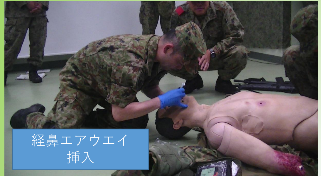
経鼻エアウェイ 挿入