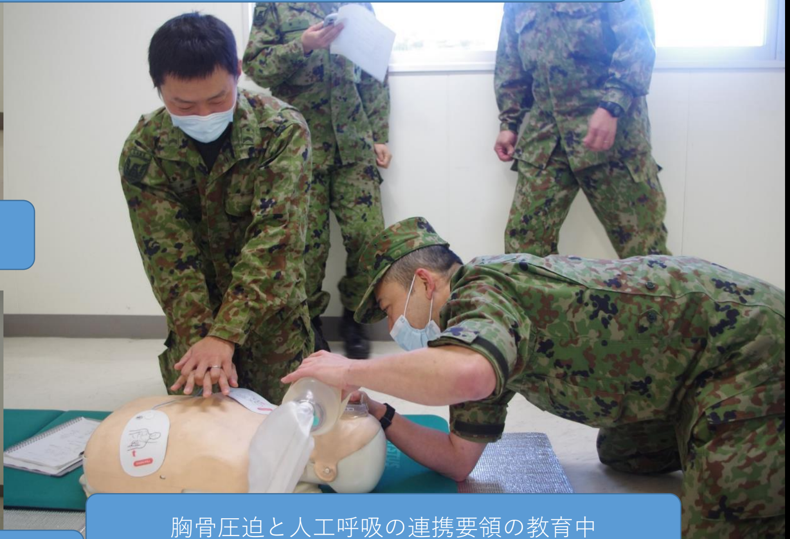
胸骨圧迫と人工呼吸の連携要領の教育中