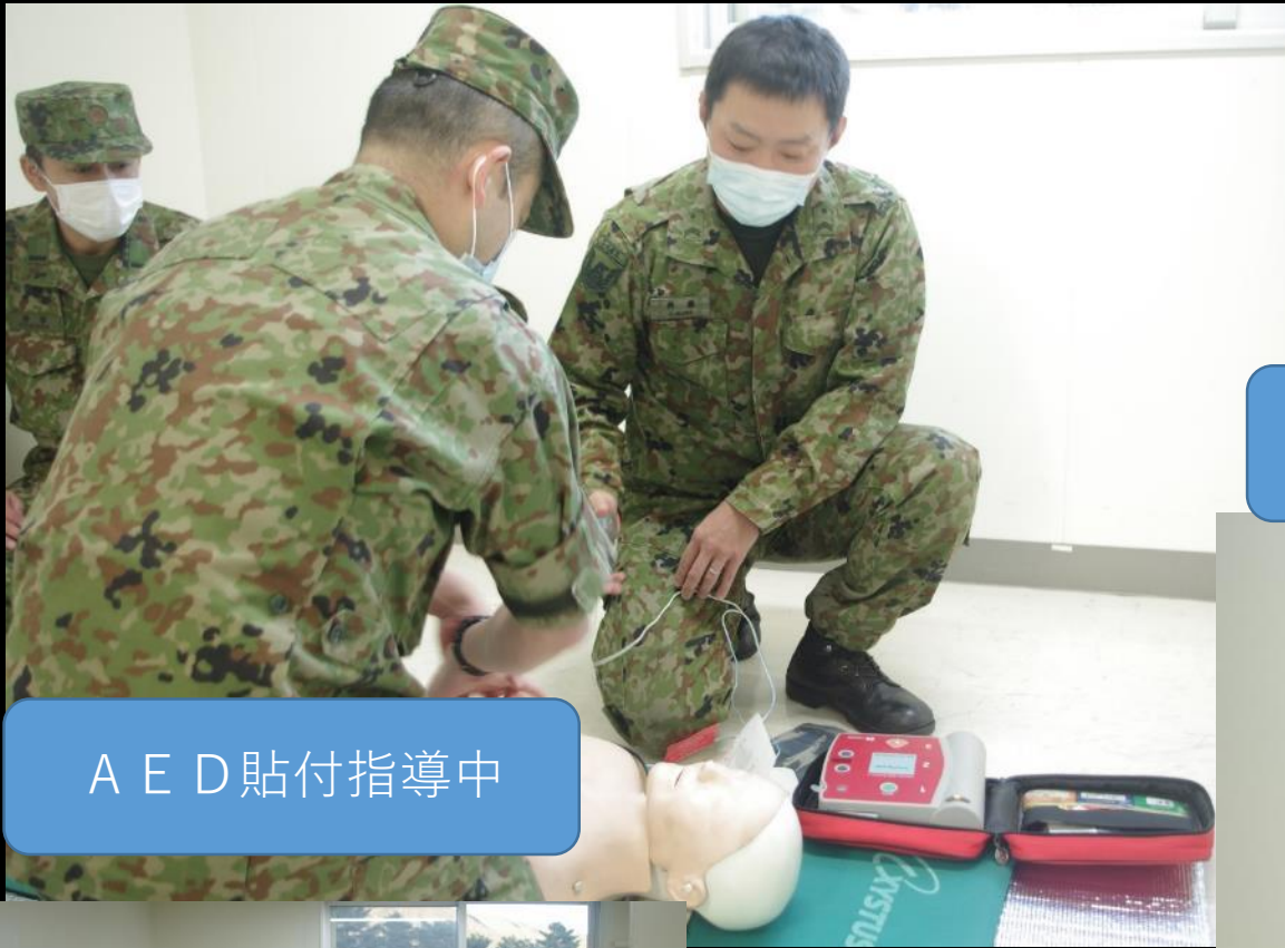
A E D 貼付指導中