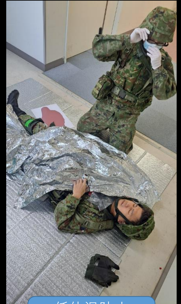
低体温防止 保温処置