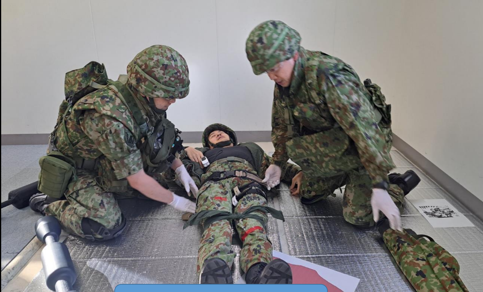
二人で連携して骨盤固定実施中