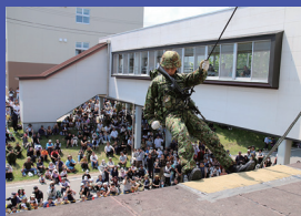
レンジャー訓練展示 午後1時15分～午後1時45分