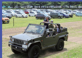
各種車両体験搭乗 午後12時30分～午後2時30分