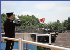
記念式典・観閲行進 午前10時～午前11時15分

※会場内では、本行事の記録と広報のための写真・映像撮影を行います。写真はホームページ等に公開される場合がありますので、予めご了承ください。