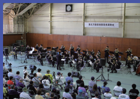
音楽演奏会 午後2時～午後2時30分