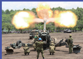
オートバイドリル・訓練展示 午前11時30分～午後12時10分