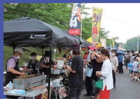
野外交売店 午前9時～午後2時30分